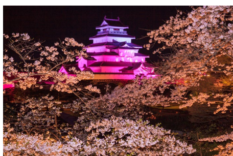
● Tsuruga Castle