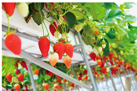
● Strawberry Picking