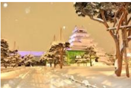
● Tsuruga Castle