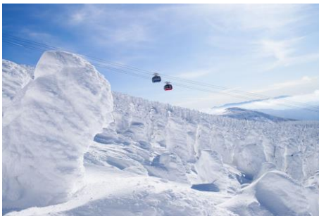
● Zao Ropeway