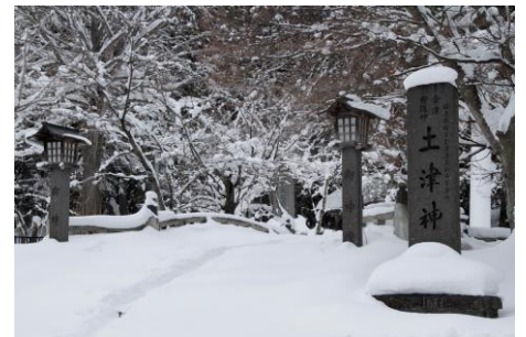
● Hanitsu Shrine