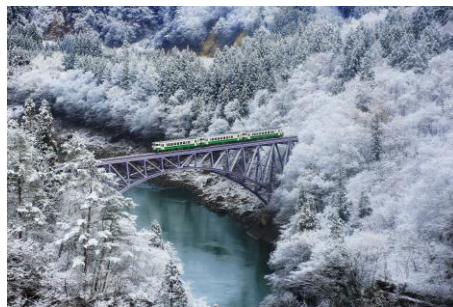
● Tadami River First Bridge Viewpoint