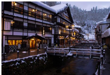
● Ginzan Onsen