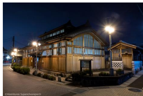
● Iizaka Onsen