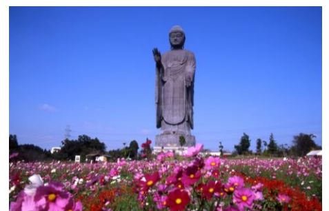
● Ushiku Daibutsu