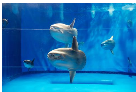
● AQUAWORLD Oarai Aquarium