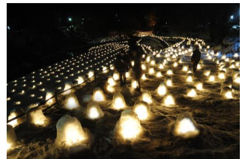
● Yunishigawa Onsen (Kamakura Festival)