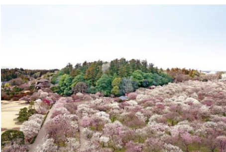
● Kairakuen Garden