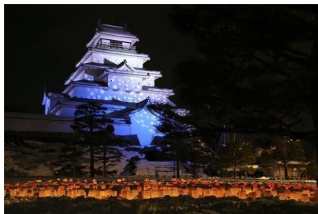
● Tsuruga Castle