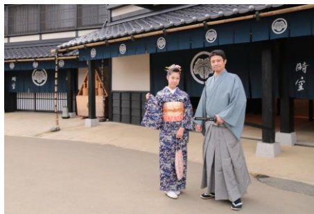
● Edo Wonderland Nikko Edomura