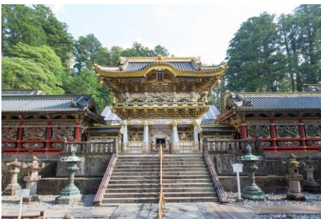
● Nikko Toshogu Shrine