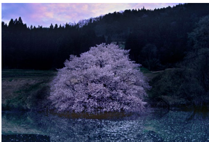
Mirror Cherry Tree