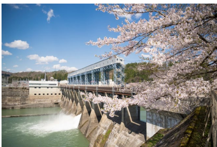
Kaminojiri Power Station