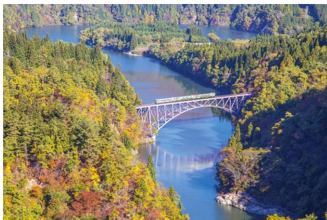
● Tadami River First Bridge Viewpoint