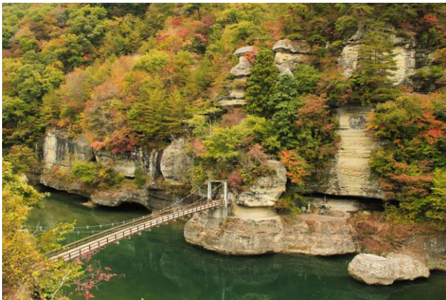
● To no Hetsuri