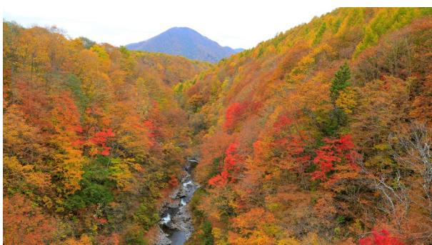
● Nakatsugawa Valley