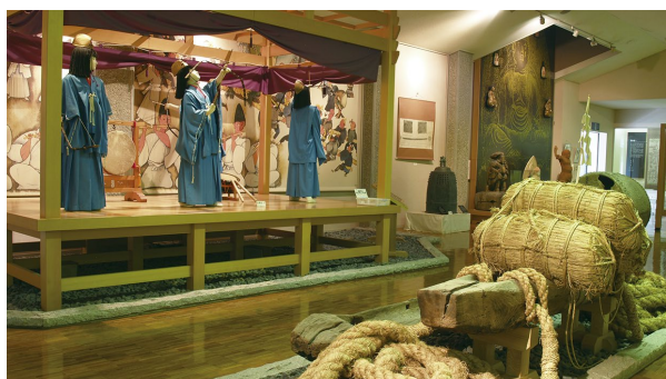
● Bandai-san Enichiji Historical Museum