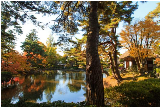
● Oyakuen Garden