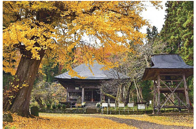
● Hoyoji Temple