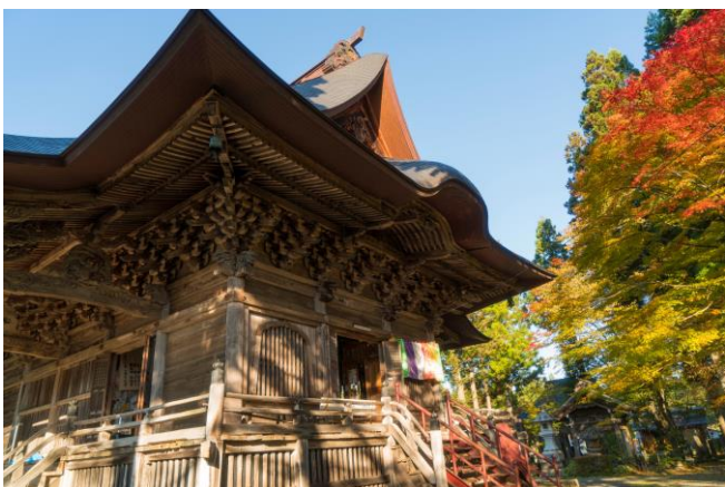
● Torioi Kannon Nyohoji Temple