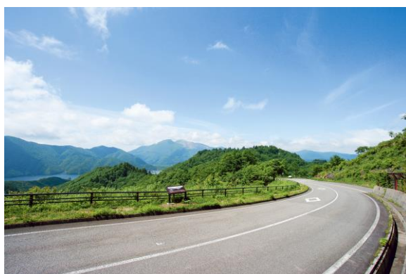
Bandai Azuma Lake Line