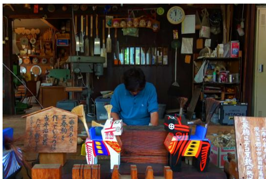
● Takashiba Deko Yashiki