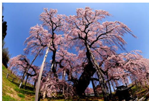
● Miharu Takizakura