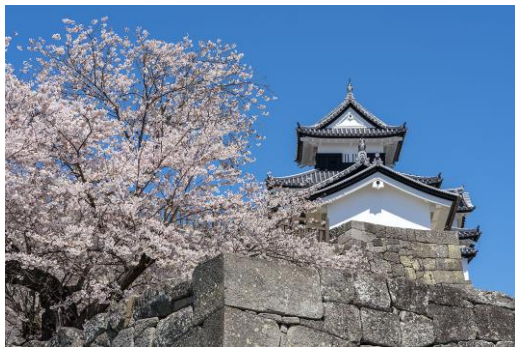
● Shirakawa Komine Castle