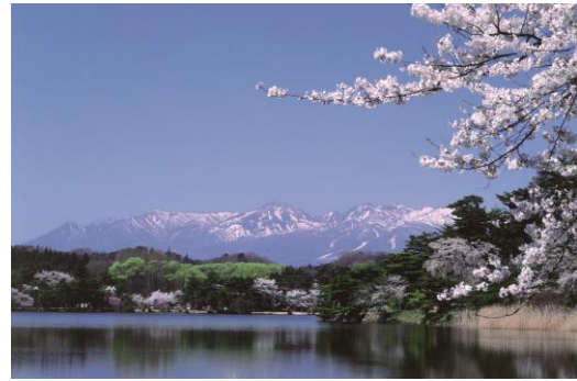
● Nanko Park