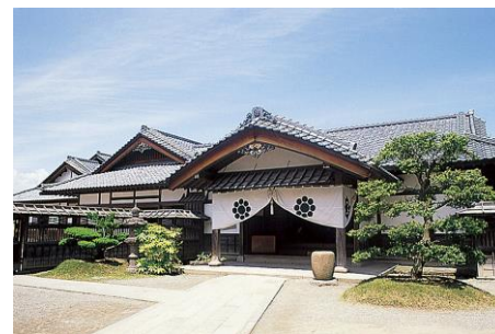
● Aizu Bukeyashiki