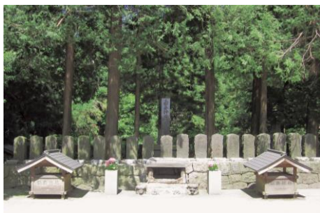
● ชมสุสาน Byakkotai