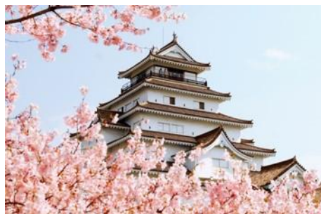
● Tsuruga Castle