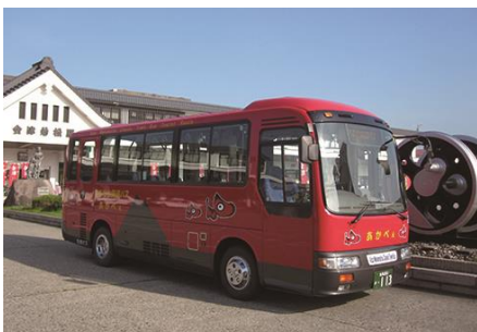
● ขึ้นรถบัสรอบเมือง Akabe หรือ Haikara-san