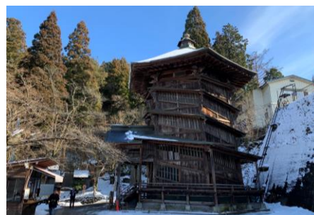
● Sazaedo Temple