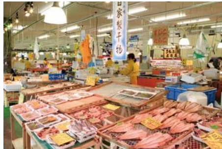
Iwaki Lalamew Fish Market