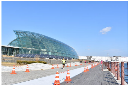
Hama Iwaki Sunshine Marathon การแข่งขันวิ่งมาราธอนอิวากิซันไชน์ いわきサンシャインマラソン

คอร์สวิ่งมาราธอนที่เริ่มออกวิ่งตั้งแต่ใจกลางเมือง วิ่งผ่านท้องทุ่งนาเขตชนบทชมธรรมชาติอันสวยงาม ผู้เข้าร่วมสามารถเลือกระยะทางตามใจชอบตั้งแต่ฮาล์ฟมาราธอน, ระยะทาง 10 กม., ระยะทาง 5 กม., ระยะทาง 3 กม., ระยะทาง 1.5 กม. สามารถเข้าร่วมได้ทั้งครอบครัวทุกวัย ◆ ช่วงเทศกาล : วันอาทิตย์ที่สองของเดือน ก.พ.