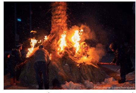
Aizu Snow and Fire Festival เทศกาลหิมะและไฟยูคิโตะชิ 雪と火のまつり

เทศกาลของไอซีที่สืบทอดกันมาอย่างยาวนาน เพื่อบูชาเทพเจ้าโดยแต่ละหมู่บ้านจะสร้างหุ่นฟางขนาดใหญ่เพื่อบูชาเทพเจ้าไซโนะคามิ เพลวไฟที่โชติช่วงในคำคืนที่ปกคลุมไปด้วยหิมะขาวโพลน ◆ ช่วงเทศกาล : วันเสาร์ที่สองของเดือน ก.พ.