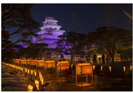
Aizu Aizu Painted Candle Festival "Yukihotaru" เทศกาลเทียนประดับภาพวาดยูคิโฮตารุ 会津絵ろうそくまつり

เทียนประดับภาพวาดเป็น 1 ในงานหัตถกรรมของไอซี เพลิดเพลินกับเทียนกว่า 10,000 เล่ม ที่ส่องแสงสว่างไสวตัดกับหิมะสีขาวโพลน ทั่วทั้งพื้นที่รอบ ๆ ปราสาทสิริงะ และสวนโอซากุเอ็ง ◆ ช่วงเทศกาล : วันศุกร์และเสาร์ที่สองของเดือน ก.พ.