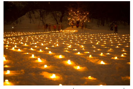
Aizu Urabandai Snow Festival เทศกาลหิมะอุระบันได 裏磐梯雪まつり

แสงเทียนกว่า 3,000 เล่มที่ส่องแสงสว่างไสวที่เรียงเกะในฤดูหนาว ความสวยงามที่สะกดทุกลมหายใจ นอกจากนี้ในฤดูหนาวที่อุระบันไดยังมีกิจกรรมมากมายให้ได้ลองทำอีกด้วย ◆ ช่วงเทศกาล : วันศุกร์ เสาร์ และอาทิตย์ของกลางเดือน ก.พ.