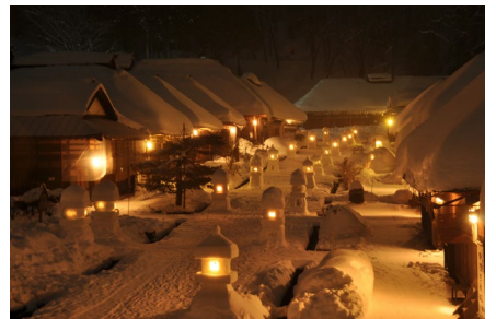
Aizu Ouchi-juku Snow Festival เทศกาลหิมะหมู่บ้านโบราณโออุจิจุกุ 大内宿雪まつり

เทศกาลฤดูหนาวที่จัด 2 วันเต็มในหมู่บ้านโบราณโออุจิจุกุ โคมหิมะอันน้อยใหญ่ที่ภายในมีไฟส่องสว่างไสวงดงาม บรรยากาศที่แสนพิเศษในฤดูหนาว อีกทั้งยังมีการแสดงดอกไม้ไฟให้ชมด้วย ◆ ช่วงเทศกาล : วันเสาร์และอาทิตย์ที่สองของเดือน ก.พ.